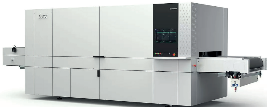
Drukarka Gamma DG

Płytki ceramiczne produkowane przez Grupę Iris Ceramica w technologii Durst Gamma DG będą przeznaczone na rynek high-end, m.in. do obiektów wellness, hoteli, budownictwa mieszkaniowego, dużych obiektów architektury publicznej. Ważnym odbiorcą będą też producenci mebli zarówno do kuchni, jak i innych wnętrz.