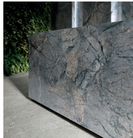
Kolekcja Monet Blue

Wachlarz zastosowanych w serii Monumental różnorodnych typologii graficznych, to najbardziej poszukiwane obecnie przez klientów wzornictwo. Jego kwintesencją jest kolekcja Monet Blue (fotografia). Zgodnie z najnowszymi trendami błękitna kolorystyka, podkreślona granatami z kontrastującymi rdzawymi żyłami, wydobywa z naturalnego kamienia jego najbardziej malarskie elementy. Wśród prezentowanych nowości znajdziemy także ponadczasową, elegancką ciałatę w cieplej tonacji wzoru Horizon Gold , ekskluzywny i magiczny onyks z rdzawo-złotym użyciem w kolekcji Invisible czy awangardowy, głęboko wybarwiony i urzekający czarny mar-