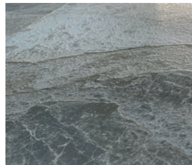
Fot. 3. Przemysłowa produkcja płytki ze strukturą z firmy SMALTICERAM wykonana za pomocą drukarki Gamma DG