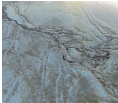
Fot. 1. Przemysłowa produkcja płytki ze strukturą z firmy COLOROBIA wykonana za pomocą drukarki Gamma DG

Oprócz ogromnego zainteresowania wielu klientów z sektora ceramicznego, drukarki Gamma DG przyciągają także uwagę producentów atramentów i szkliva. Tak naprawdę, niektórzy z nich już mieli możliwość poznać proces przemysłowej produkcji takich płytek oraz dowiedzieć się o zaletach tej innowacyjnej i rewolucyjnej technologii cyfrowego druku struktur od pierwszych klientów, którzy zainstalowali nasze urządzenia (fotografie 1, 2 i 3).