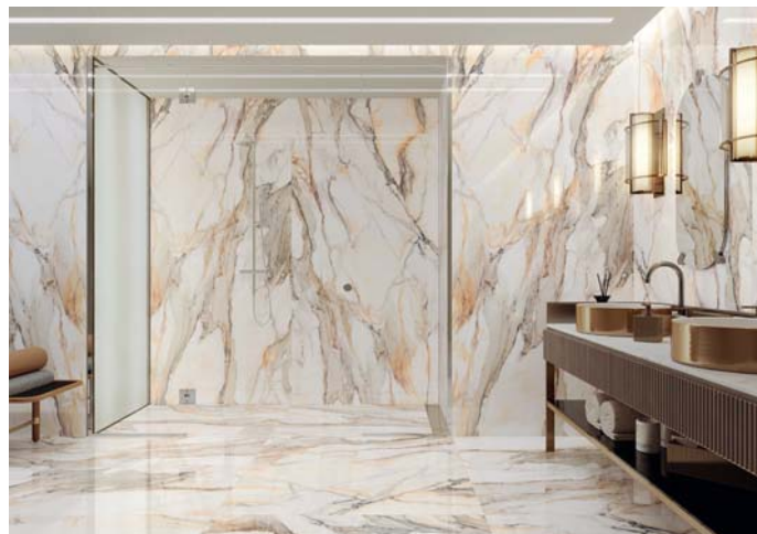
Kolekcja Calacatta Gold

Calacatta Gold to kolekcja przepięknie żyłkowanych, perfekcyjnie oddających rysunek luksusowego marmuru płytek gresowych, które dodadzą wnętrzu szyku i ponadczasowej elegancji. Płytki w odcieniach bieli, szarości, muśnięte złotym kolorem, rozświetlą i ożywią aranżowaną przestrzeń, a w połączeniu z dekorami nadadzą jej niespotykany dotąd charakter. Odpowiedni wybór formatu płytek z kolekcji Calacatta Gold pozwoli na uzyskanie wrażenia jednolitej powierzchni przypominającej monolityczny blok marmuru.