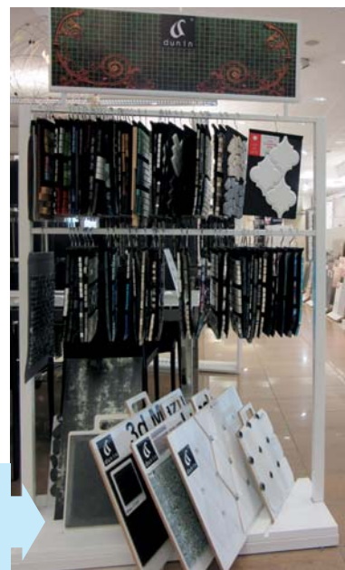
Kolekcja ARABESCO firmy DUNIN Sp. z o.o. – Perła Ceramiki UE 2016