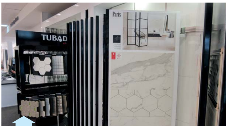
Kolekcja PARIS Grupy Tubądzin – Perła Ceramiki UE 2016, Perła Ceramiki Projektantów – użytkowników CAD Decor 2016