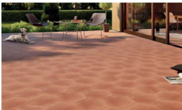
Fot. 1. Klimatyczna aranżacja tarasu z wykorzystaniem płytek heksagonalnych o ciepłym zabarwieniu z kolekcji Aquarius. Cieniowany efekt ombre podkreśla wrażenie trójwymiarowości