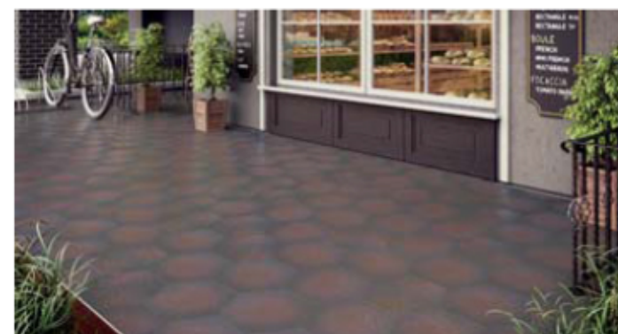
Fot. 3. Aranżacja z wykorzystaniem heksagonalnych płytek klinkierowych z kolekcji Semir, idealnych na taras w centrum miasta

parametry są gwarancją długoletniego użytkowania, bez zmiany koloru czy faktury płytek. Należy przypomnieć, że klinkier produkuje się w technologii ciągnięcia lub prasowania. Ten drugi rodzaj ma szczególnie wiele zalet.