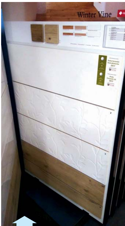
Kolekcja WINTER VINE marki Opczno – Perła Ceramiki UE 2017, Perła Ceramiki Dystrybutorów 2017

Firma Korab Sp.j. prężnie działa na rynku od dwudziestu lat. Specjalizuje się w kompleksowym wyposażeniu łazienek. Ma w ofercie m.in. płytki ceramiczne do zastosowania wewnątrz i na zewnątrz obiektów, kabiny natryskowe, wanny, baterie łazienkowe i kuchenne, zlewozmywaki, a nawet sauny. Wszyscy nasi klienci mogą skorzystać z pomocy wykwalifikowanych sprzedawców oraz projektantów w jednym z trzech oddziałów w: Toruniu, Bydgoszczy oraz Inowrocławiu. Naszą dewizą jest satysfakcja klienta, dlatego oferujemy produkty bardzo dobrej jakości, w tym kolekcje płytek ceramicznych nagrodzone w konkursie PERŁY CERAMIKI UE. Płytki te wyróżniają się spośród innych jakością oraz wzornictwem i cieszą się dużym zainteresowaniem klientów. Mamy w ofercie wyjątkowo bogatą gamę produktów różnicowanych pod względem ceny i designu, zarówno zagranicznych, jak i polskich producentów. Dysponujemy ogromnymi stanami magazynowymi importowanych płytek, dzięki czemu udostępniamy je naszym klientom „od ręki”. Do potrzeb każdego klienta podchodzimy indywidualnie i staramy się im sprostać z największą starannością. Serdecznie zapraszamy!!!