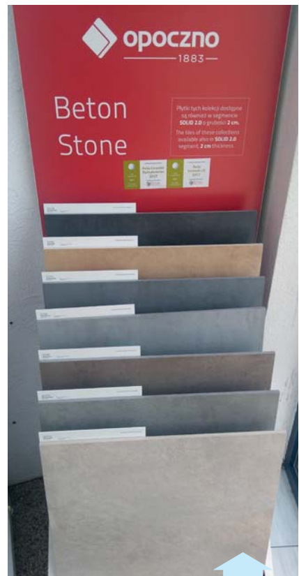
Kolekcja BETON marki Opczno – Perła Ceramiki UE 2017, Perła Ceramiki Dystrybutorów 2017