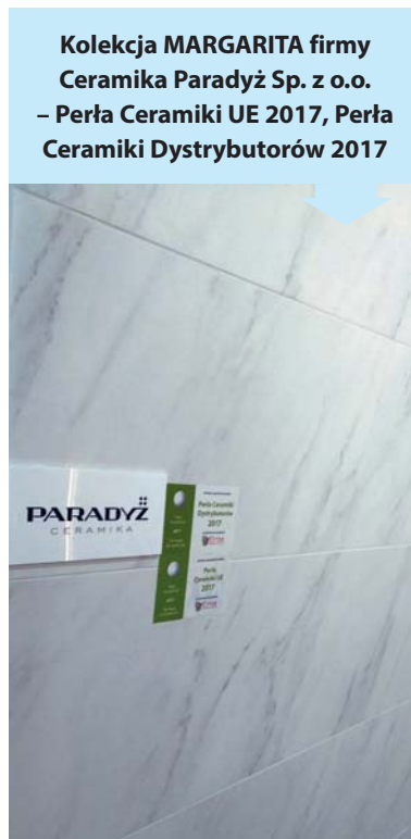
Kolekcja MARGARITA firmy Ceramika Paradyż Sp. z o.o. – Perła Ceramiki UE 2017, Perła Ceramiki Dystrybutorów 2017