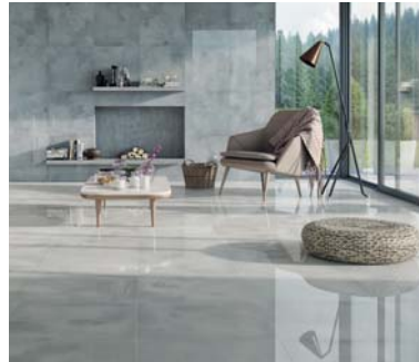
Kolekcja Naturstone, Ceramika Paradyz Sp. z o.o.