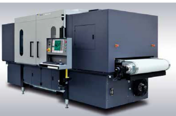
Drukarka nowej generacji firmy Durst – GAMMA XD

POLINDEX W.P. Kozłowski tel. (54) 232 10 27; faks (54) 232 10 28 e-mail: polindex@polindex.com.pl www.durst-online.com